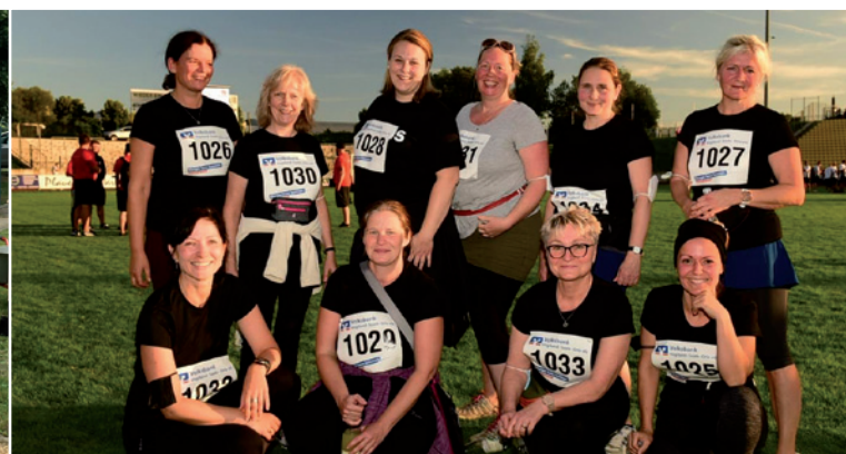
Team des Kinderhaus in Plauen nach erfolgreicher Teilnahme beim Firmenlauf