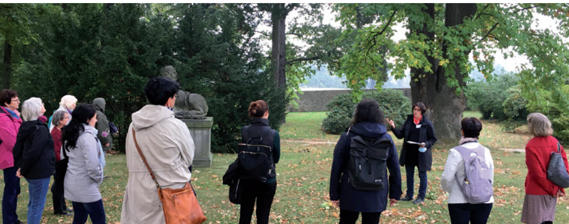
Waldspaziergang für alle Sinne beim Oasentag auf Gut Schmochtitz