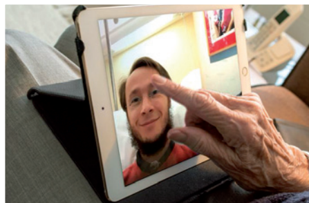
Videochat mit Patienten

Wunsch nach Videotelefonie direkt beim Stationspersonal an, Angehörige können den Wunsch telefonisch beim Seelsorger anmelden. Gemeinsam werden Zeit und Zugangsdaten abgesprochen. Für den Chat werden eine Skype-Verbindung und Tablet-Computer direkt am Patientenbett genutzt. Für die Absprache und weitere Fragen stehen die Seelsorger der beiden Häuser, Vincenc Böhmer in Kamenz und Diakon Bernd Schmuck in Görlitz, gern persönlich im Haus oder per Telefon zur Verfügung.