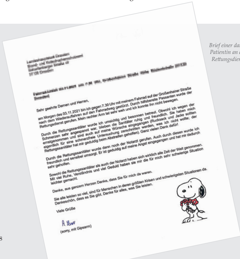
Brief einer dankbaren Patientin an den Malteser Rettungsdienst