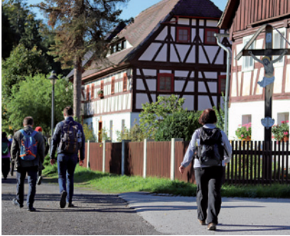
Pilgern entlang des Jakobswegs in Ostritz