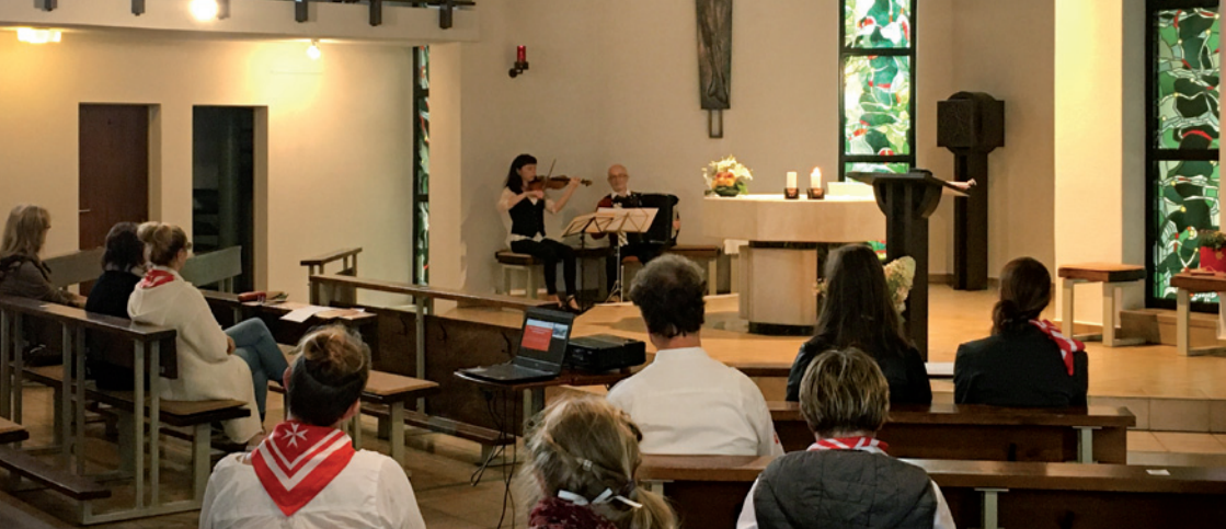
Andacht zum Herbstfest des Hospizdienstes in der Niederlausitz