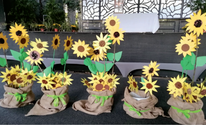
Sonnenblumen als Erinnerungsstück zum Mitnehmen