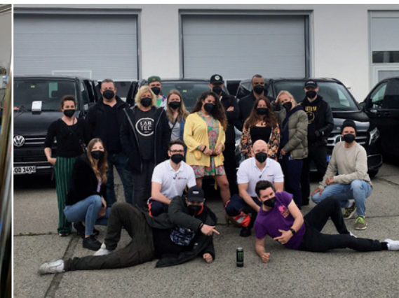
Die Crew hinter den Kulissen bei den Filmaufnahmen