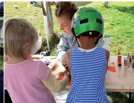
Stand der Gorki120 auf dem LOFE (Leipziger Osten Fest)