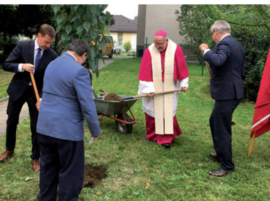
Baumpflanzung zum Jubiläum des Malteser Hilfsdienstes in Görlitz

Aus dem 20-köpfigen Team des Malteser Kinderhauses in Plauen nahmen insgesamt 10 hochmotivierte Kolleginnen teil, was dem Kinderhaus in der Firmenwertung einen beachtlichen 12. Platz einbrachte. Im nächsten Jahr will das Team auf jeden Fall wieder am Start sein.