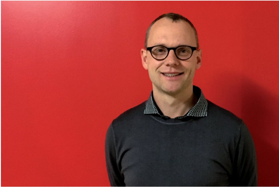
Fachreferenten und Produktverantwortlichen Schulbegleitdienst