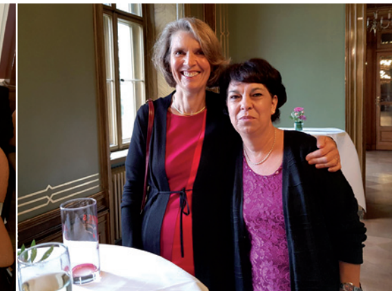
KiTT Team Dresden freut sich über die Auszeichnung mit der Annen-Medaille