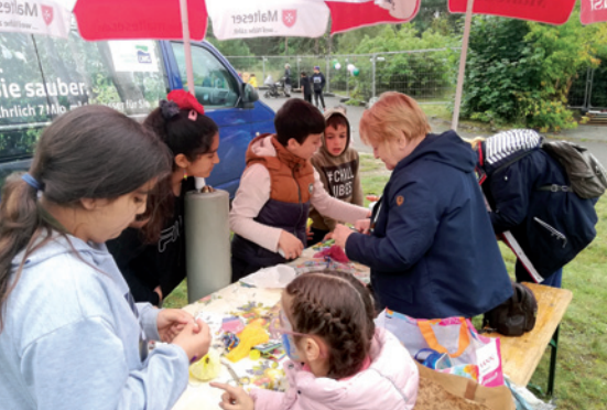
Mitarbeitende und Ehrenamtliche des Integrationsdienst trotzten dem Regen beim Stadtteilfest Sachsendorf in Cottbus