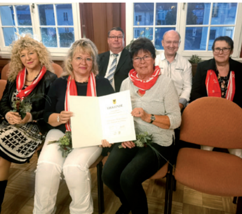
Die Ehrenamtlichen freuen sich über die Auszeichnung und Würdigung ihrer Arbeit