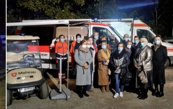
Ehrenamtliche und Mitarbeitende des Treffpunkt Prohlis zu Besuch bei den Einsatzdiensten Dresden