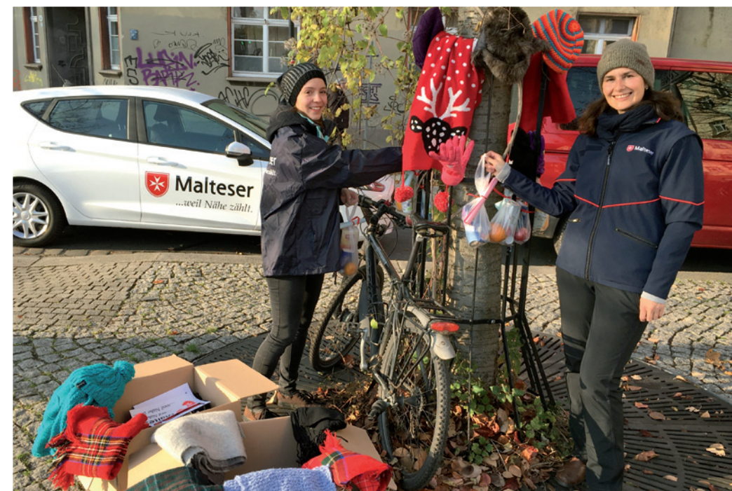
Das Team des Malteser Besuchs- und Begleitdienstes bestückt den Gabenplatz

DRESDEN. Anlässlich des „Welttag der Armen“, organisierte ein Team des Besuchs- und Begleitdienstes für den 11. + 12.11.2021 in Dresden Pieschen einen Gabenplatz. Mitarbeitende des aus diesem Anlass Spenden für bedürftige Menschen gesammelt. Es gab Tüten mit Hygieneartikeln, Obst, Leckereien und kleinen Überraschungen zum Mitnehmen. Zu den Spenden gehören auch warme Mützen, Schals, Handschuhe, Schlafsäcke und Decken. Die Mitarbeitenden waren mit warmen Kaffee vor Ort und Bedürftige waren eingeladen vorbeizukommen und sich kostenlos kleine Tüten und nach Bedarf warme Sachen mitzunehmen.