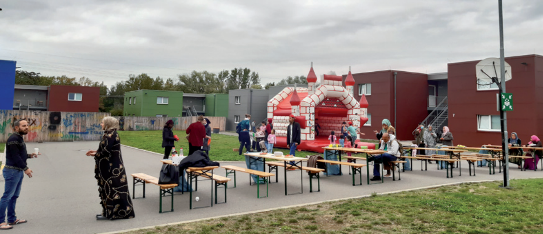
Spiel, Spaß und gutes Essen zur Jubiläumsfeier der Gemeinschaftsunterkunft Thekla

LEIPZIG.. Zum 5-jährigen Jubiläum der GUK Thekla in Leipzig wurde am 24. September auf dem Innenhofgelände der Einrichtung zusammen mit Bewohnerinnen und Bewohnern, Personal, Netzwerk- und